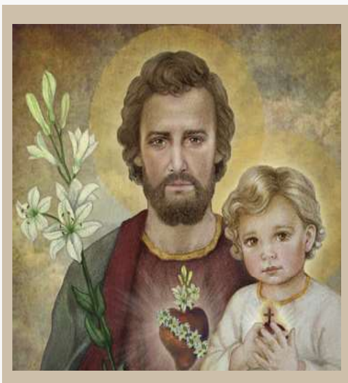
San José, Ruega por Nosotros